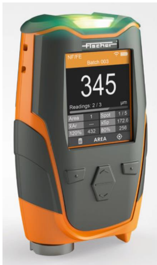
MMS® Inspection DFT